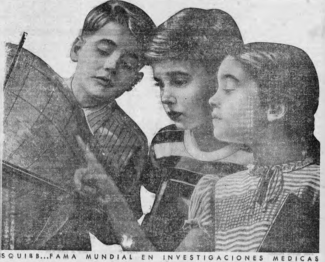
SQUIBB...FAMA MUNDIAL EN INVESTIGACIONES MEDICAS