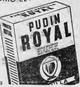
PUDIN ROYAL Apartado 1465, San José Dep. 3729